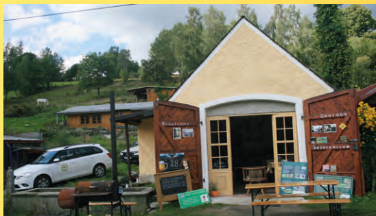
Srdce Poohří, Osvinov.

Poznámka: V místě konání jsou omezené možnosti parkování.