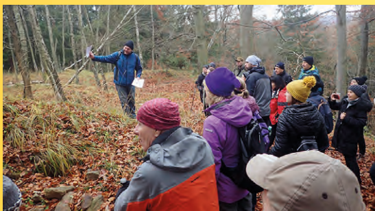
Z archeologických exkurzí.