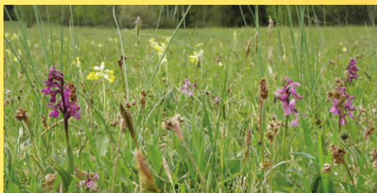
PR Hvoždanská louka.