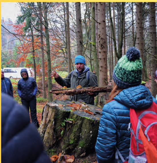
Mykologická exkurze do PR Pleš (2021).