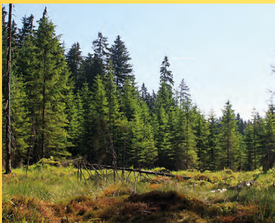
PR Smraďoch.