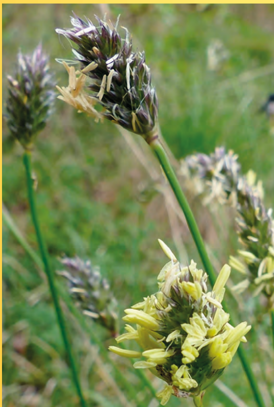
Pěchava slatinná u Kamenného Dvora.

Poznámka: Obuv a oblečení do velmi podmáčeného terénu. Ideálně holínky nebo průtočnou obuv.