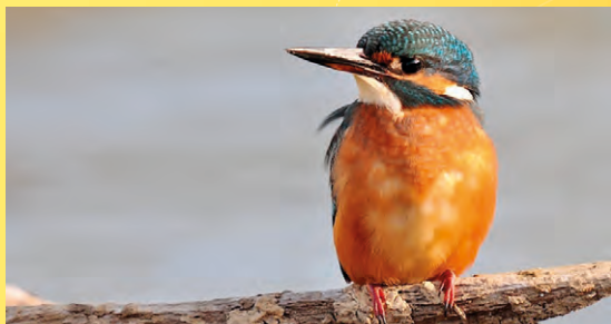
Ledňáček říční.

Poznámka: Obuv a oblečení do terénu, dalekohled vítán.