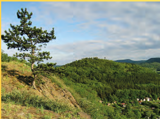
Svatý vrch, Kadaň. Foto: R. Fišer.