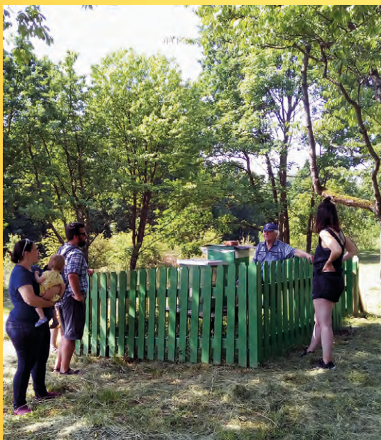
Setkání se včelařem.