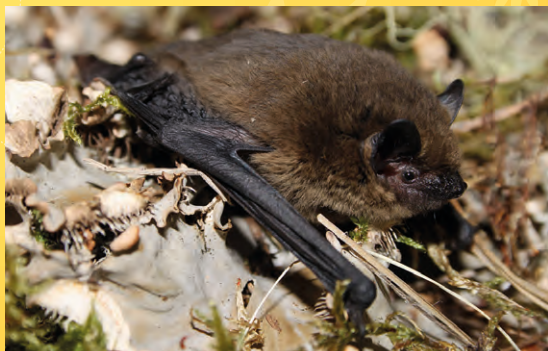
Netopýr hvízdavý.