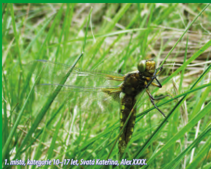
1. místo, kategorie 10–17 let, Svatá Kateřina, Alex XXXX.