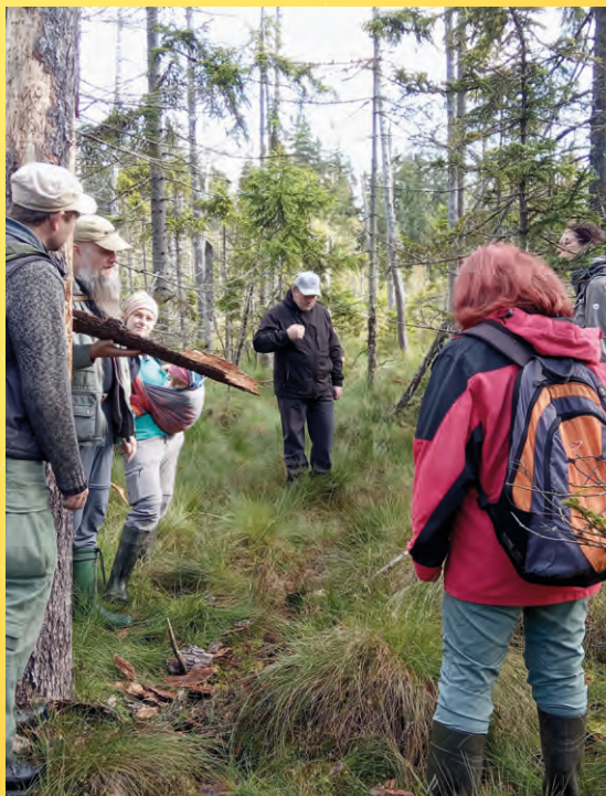
Exkurze do NPR Kladské rašeliny.

Poznámka: Počet účastníků na exkurzi je limitovaný (15 osob) z důvodu vstupu do NPR a je nutné se předem registrovat na e-mailu: jana.rolkova@nature.cz . Registrace bude ukončena při naplnění kapacity nebo nejpozději 16. 9. 2022. Je nutné oblečení a voděodolnou obuv do terénu, dále svačinu a dostatek tekutin.