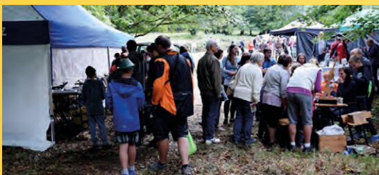
Den Českého lesa, Křížová Huť (2018).