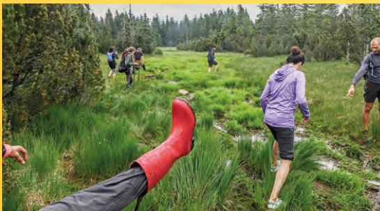
V rašeliništi na Přebuzi v roce 2021.