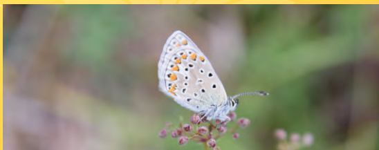
Modrásek jehlicový v PR Milčice.

Poznámka: Terénní obuv, repelent a svačinu s sebou. V případě špatného počasí (zima a déšť) se exkurze ruší. Sledujte www.ceskyles.ochranaprirody.cz .