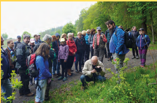
Z exkurze Za valečskou květenou v roce 2019.