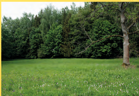
Za orchidejemi do parku.

Poznámka: Obuv a oblečení do terénu, louka může být dosti vlhká.