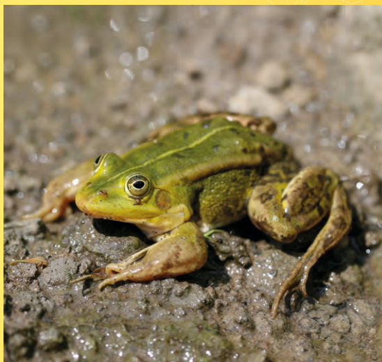
Skokan zelený.

Poznámka: V místě konání jsou omezené možnosti parkování.