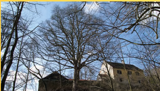
Vildenava, javor klen pod samotou.

Poznámka: Pevná obuv a oblečení do terénu. Svačinu a fotoaparát s sebou.