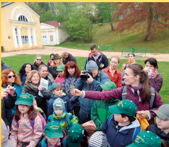
Vítání ptačího zpěvu v M. Lázních.