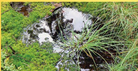
Ztracený rybník, tůňka v rašeliništi.