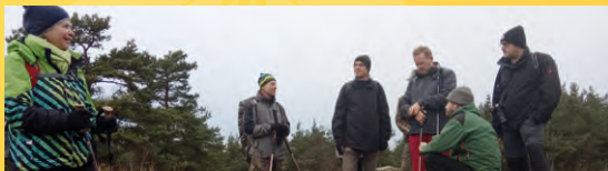
Napříč Slavkovským lesem.

Poznámka: Nutná je vhodná obuv a oblečení do terénu. Nezapomeňte na dostatek tekutin a jídla na celý den. Doporučujeme vzít si s sebou mapu pro případ dřívějšího návratu nebo nutného rozdělení skupiny. Vzhledem k tomu, že nemusíme dojít za světla, je vhodné mít také baterku. Pro značnou náročnost nemůžeme akci doporučit svátečním chodcům. Účastníci se akce účastní na vlastní nebezpečí.