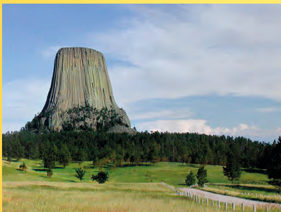
Devils Tower (česky Ďáblova věž), Wyoming, USA.

Poznámka: Přednáška je součástí chebské muzejní noci.