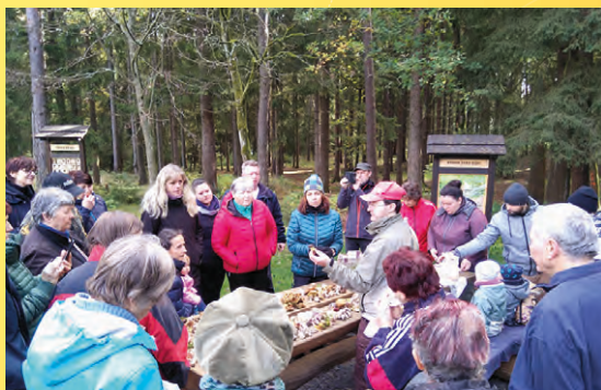
Výstavka hub na Zelené hoře 2021.

Poznámka: Vhodné oblečení a obuv do terénu, košík na houby! Špekáčky!