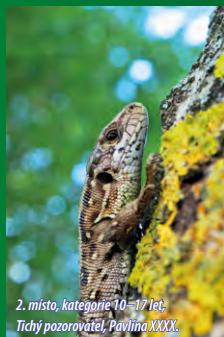
2. místo, kategorie 10–17 let, Tichý pozorovatel, Pavlína XXXX.