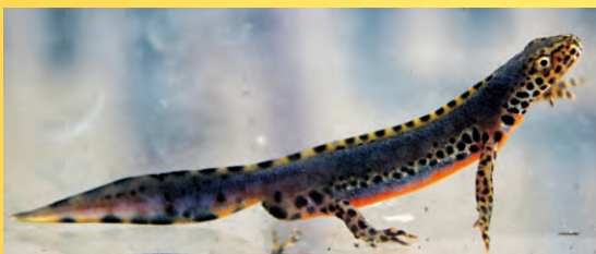
Čolek horský.