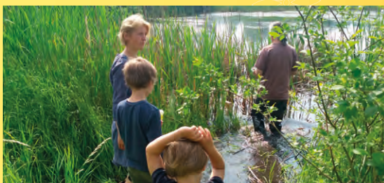
V Libockých mokřadech.

Poznámka: Obuv a oblečení do terénu, holínky!