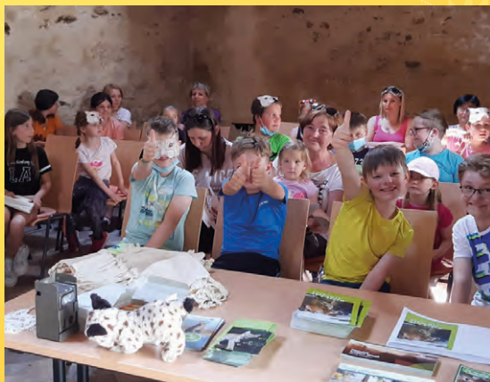
Ryší den v Domu přírody českého lesa (2021).

Poznámka: Podrobnější informace budou sděleny před konáním akce na www.ceskyles.ochranaprirody.cz .