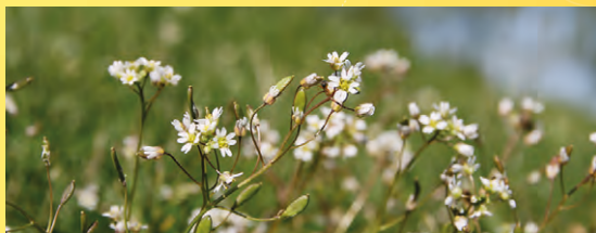
Osívka jarní.