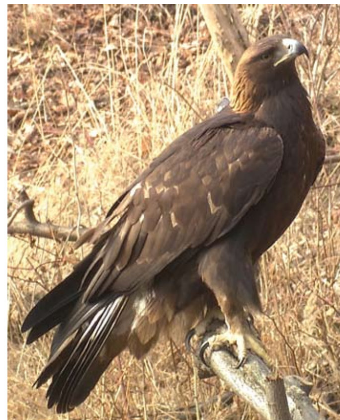
Vyhlášení PR Lysá hora spolu s projektem „Návrat orla skalního do ČR“ snad přispějí k jeho opětovnému zahnízdění, foto: P. Orel