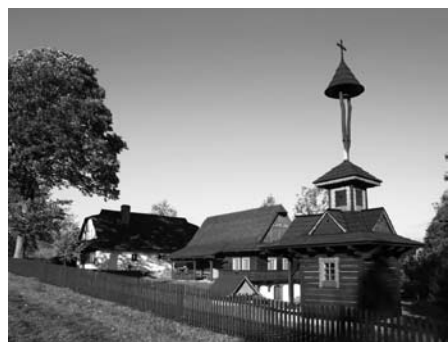
V prostorách Památníku bratří Strnadlů v Trojanovicích mimo jiné naleznete četné informace o vystěhovaných krajanech

Když byla v roce 1973 založena CHKO Beskydy, byla to první organizace, kam jsem se šel přihlásit jako dobrovolný strážce přírody, protože se mi nelíbila devastace krajiny. Domníval jsem se, že to bude instituce, která bude mít rozsáhlé pravomoci. Ale jak říká jeden kronikář: „Byl jsem však ve svých nadějích trpce zklamán.“ Hlavně v 80. letech,