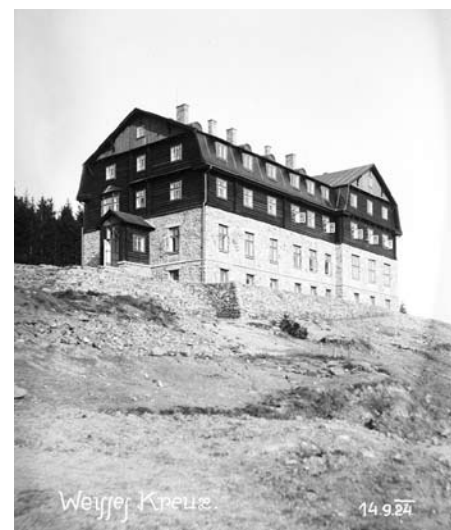
Původní dřevěný hotel „Weisse Kreuz“ v roce 1936 vyhořel, vzápětí však byl na jeho místě postaven nový „Berghotel“ ve stylu funkcionalismu. Vedle hotelu byla nově vystavěna zvonička.

Zásadní proměna Bílého Kříže nastala po nástupu a razantním rozvoji průmyslu na Ostravsku. Do té doby tzv. církevní turistika, tedy poutníci chodící na známá poutní místa – Radhošť, Hostýn, Prašivou apod., začali být vytlačováni turistikou s širším kulturním a duševním rozměrem až po komercializaci, jak ji známe nyní. V polovině 19. století vznikaly sportovní, turistické, kulturní, okrašlovací a jiné spolky. Lidem se do hor příliš nechtělo, a tak nezbyvalo, než je na něco nalákat. Toho využili podnikavější hospodáři, hajní a lesní správci. Ti v počátcích poskyto-