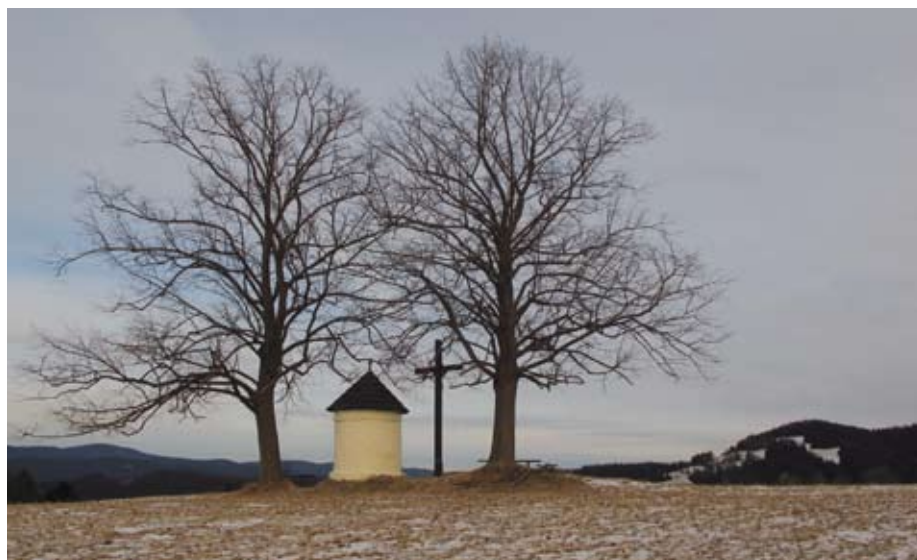
Kaplička na Štrčkové je jednou z mnoha karlovských kapliček

Je otázkou, zda se jedná o lidovou architekturu nebo o přírodní krásy. V prvním případě doporučuji zhlédnout Karlovské fojtství (národní kulturní památka), kostel s farou, muzeum a množství drobné sakrální architektury. Velmi zajímavá je i Památkově chráněná vesnická zóna Podtaté s původní rozptýlenou vesnicí zástavbou. Milovníkům přírody bych doporučil projít si hřeben Benešek, Javorničku, Javorníků, popř. si prohlédnout jedlobukový prales Razula nebo Karlovské jezero.