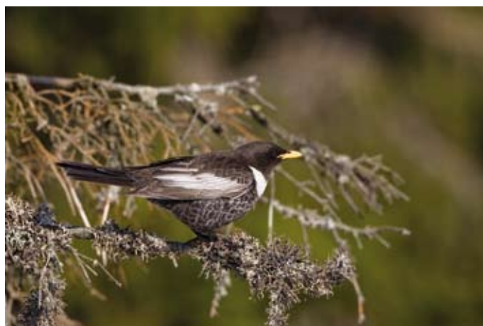
Kos horský se vyskytuje nejčastěji v jehličnatých lesích horských oblastí, foto: P Šaj