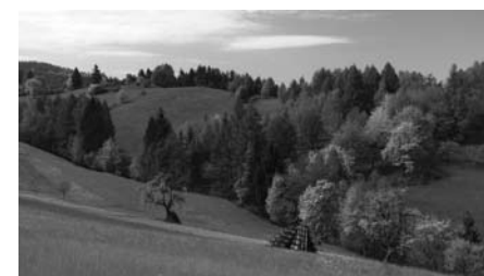
Pastviny pod hřebenem Hluboček v Huslenkách

Obecně řečeno je v I. zóně maximálně podporováno šetrné a přírodě blízké hospodaření. Konkrétním nástrojem ochrany přírody jsou například cílené dotace na údržbu luk a pastvin z Programu péče o krajinu. V roce 2010 Správa CHKO rozdělila finance na sečení a pastvu na asi 130 ha luk a pastvin v I. zóně (viz také Zpravodaj č. 2/2011). V lesích jsou dotovány přírodě blízké postupy hospodaření, jako je podpora přirozeného zmlazení a cílená péče o jedli bělokorou. Kromě snadnějšího přístupu k zemědělským i lesnickým dotacím jsou pozemky v I. zóně osvobozeny od daně z nemovitosti.