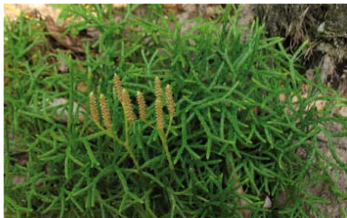
Ohrožená rostlina plavuník zploštělý má nejraději polostín

Základní údaje Rozloha: 63,62 ha Datum vyhlášení: 15. 12. 2010 Katastrální území: Krásná pod Lysou horou