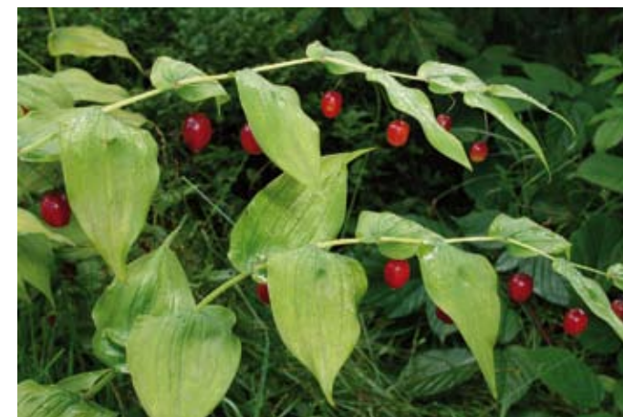
Čípek objímavý je nápadný svými červenými bobulemi, foto: M. Popelářová