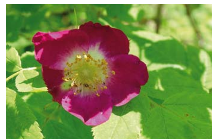
Růže převíslá patří mezi horské druhy rostlin, foto: F. Jaskula