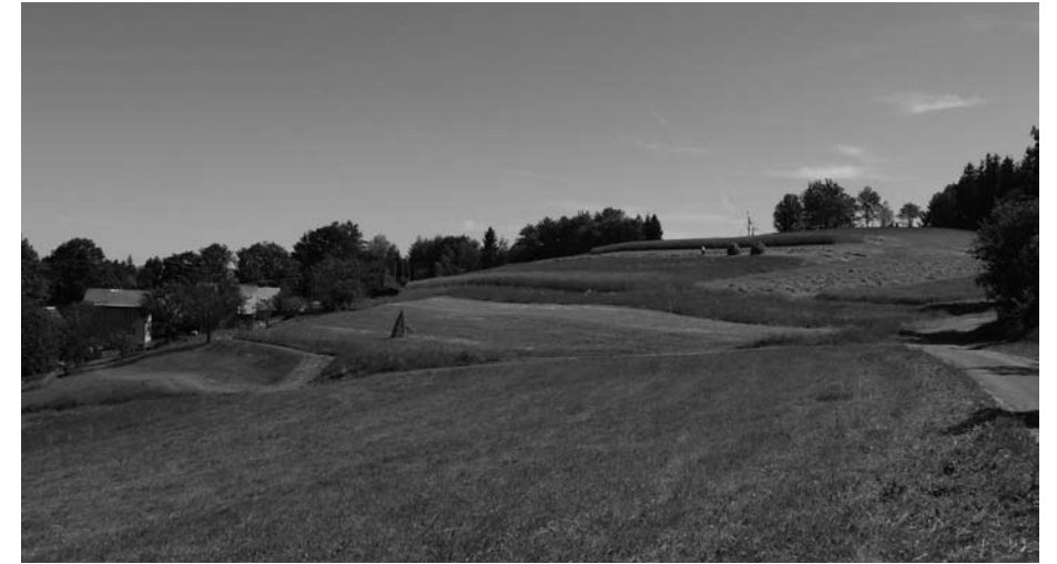
II. zóna – obhospodařovaná krajina s řídkým osídlením na hřebeni Soláně, Hutisko-Solanec

Z důvodu ochrany cenného prostředí zákon o ochraně přírody a krajiny v I. a II. zóně nedovoluje hospodaření vyžadující tzv. intenzivní technologie. Myšleny jsou tím zejména zásahy spojené s velkými terénními úpravami, změnami vodního režimu a další činnosti, které by mohly omezit existenci vzácných druhů i prostředí jako takového. Příkladem může být hnojení průmyslovými hnojivami a kejdou, mulčování, odvodňování luk, výstavba lyžařského areálu, hotelu, ale i přeměna přírodního lesa holosečí na uměle vysázený nepůvodní smrkový les. V I. zóně zároveň platí zákaz umísťování nových staveb, prováděny jsou jen rekonstrukce stávajících.