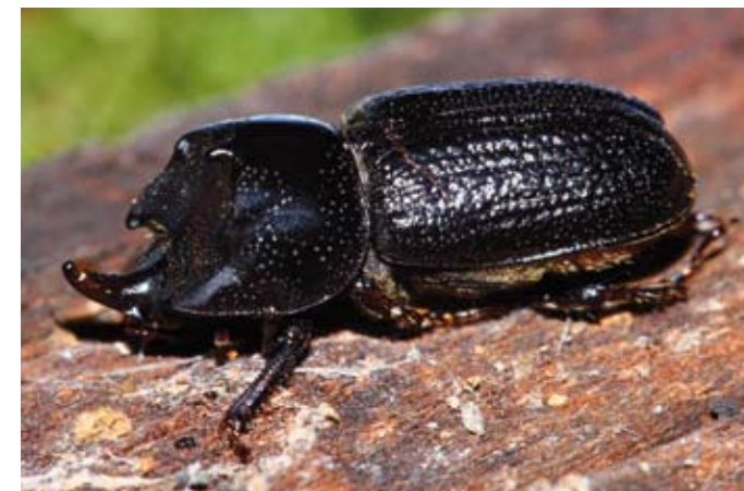
Roháček bukový je nenápadný malý brouk, který je vázán na mrtvé dřevo