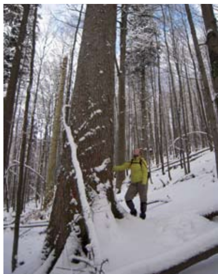
Jedna z obřích jedlí v NPR Razula

Javornický hřeben přímo vybízí k nenáročným túrám, v létě pěšky a v zimě na běžkách. Na zdejších kopečkách můžete potkat množství kapliček a božích muk. Dřevěný kostel a muzeum stojí blízko sebe na začátku údolí Pluskovec. Obě stavby jsou také významnými turistickými cíli. Národní kulturní památkou je Karlovské fojtství, stojí na začátku údolí Bzové. Jedná se o dřevěně stavení z roku 1973, tato malebná stavba sloužila k natáčení nejednoho filmu.