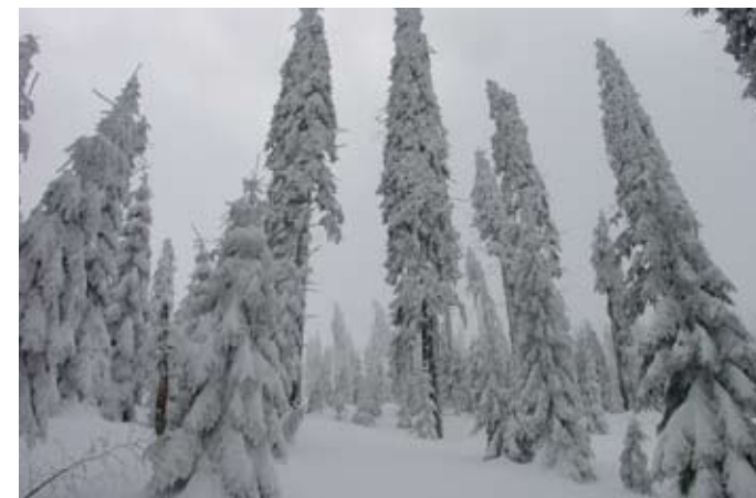
Původní beskydský smrk se štíhlou korunou, která lépe odolává velkému zatížení sněhem