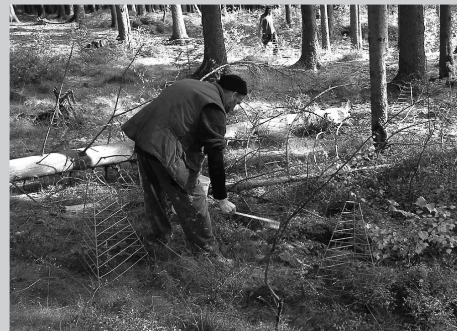
Účinnou ochranou mladých jedlí před okusem zvěří je použití klecových oplůtků