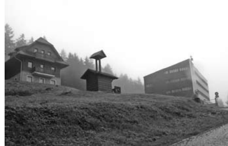
V současné době slouží renovovaný hotel Bílý Kříž jako luxusní rezidence s apartmánovými byty. Hospodářské budovy za novou zvoničkou byly v roce 2009 přestavěny na apartmánové byty patřící k Bílému Kříži.

vali skromnou stravu, případně nocleh, a to zpravidla jen v létě. Později vznikaly útulny, horské chaty a hotely s celoročním provozem, které skýtaly potřebné zázemí s vyšším komfortem.