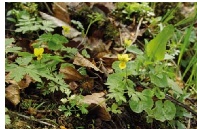
Violka dvoukvětá je horský druh rostoucí především na vlhkých místech nelesních stanovišť