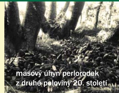
masový úhyn perlorodek z druhé poloviny 20. století