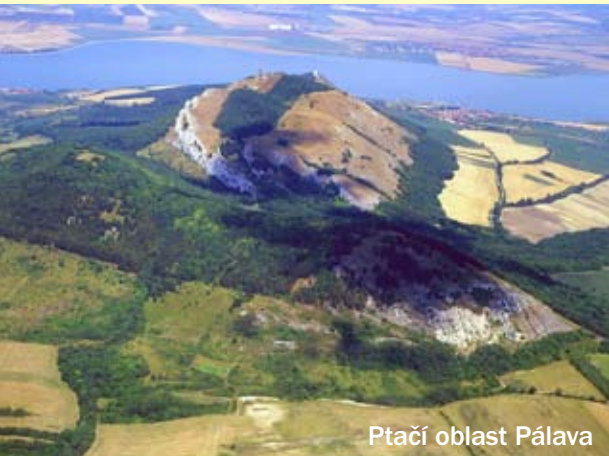
Ptačí oblast Pálava

Pro prohlídku kontaktujte AOPK ČR na tel. 724918198.