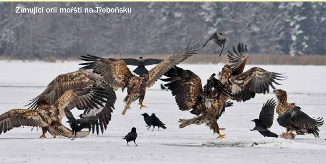
Zimující orlí mořští na Třeboňsku

Početnost hnízdní populace orlů mořských na našem území od roku 1984 stoupá, přesto je tento druh stále oprávněně zařazen do kategorie kriticky ohrožených druhů . Vzhledem k tomu, že naše populace orlů mořských je významná i z hlediska EU, je tento druh také chráněn evrop-skou legislativou a byly pro něj vyhlášeny 3 ptačí oblasti – Třeboňsko (hnízdění a zimování), Střední nádrž vodního díla Nové mlýny (zimování) a Pálava (hnízdění a zimování).