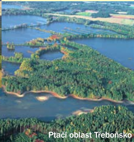
Ptačí oblast Třeboňsko

Pro MŽP zpracovala Agentura ochrany přírody a krajiny ČR (AOPK ČR)