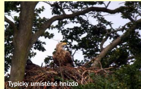
Typicky umístěné hnízdo