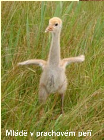
Mládě v prachovém peří

Pro MŽP zpracovala Agentura ochrany přírody a krajiny ČR (AOPK ČR)