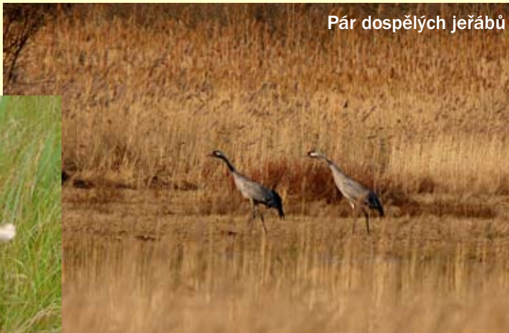
Pár dospělých jeřábů

Pro prohlídku kontaktujte AOPK ČR na tel. 724918198.